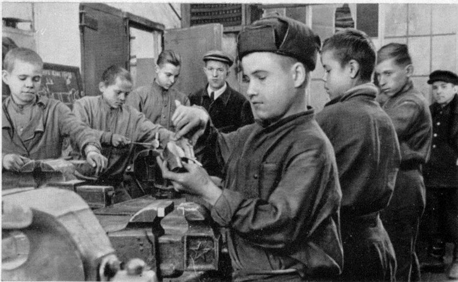
Ученики ремесленного училища № 25 на автозаводе